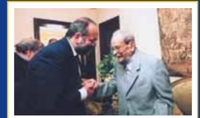
Cairo, 2003 - Il Premio Nobel Naguib Mahfuz definisce i membri della Fondazione "costruttori di dialogo e di pace"