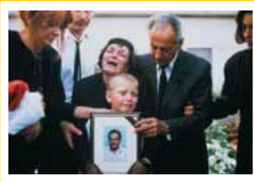
Sarajevo, 1995 - Una delle 200.000 vittime