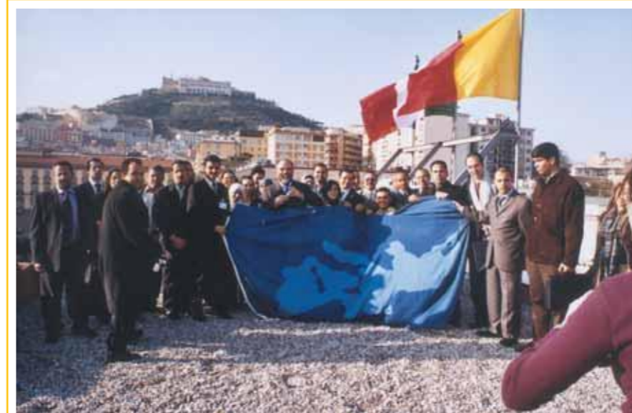
Napoli, 2005 - Incontro con giovani di 35 Paesi Euromediterranei