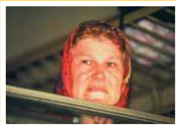
Sarajevo, 1994 - Profughi