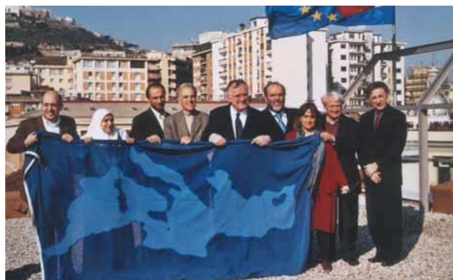
Napoli, 2004 - L'inizio del Programma "Mediterraneo, Europa e Islam: Attori in Dialogo"