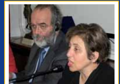
26 marzo 2007, Napoli. Il premio Nobel Shirin Ebadi dà inizio al programma contro le mine antiumo