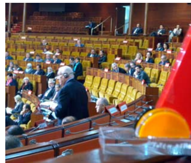
Il Presidente della Knesset, Reuven Rivlin, interviene all'Assemblea Parlamentare del Mediterraneo: in primo piano, il "Simbolo della Pace".