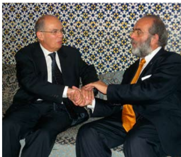
Il sindaco di Rabat Fathallah Oualalou dà il suo accordo per la realizzazione dell'opera monumentale a Rabat dinanzi alla Biblioteca Nazionale.