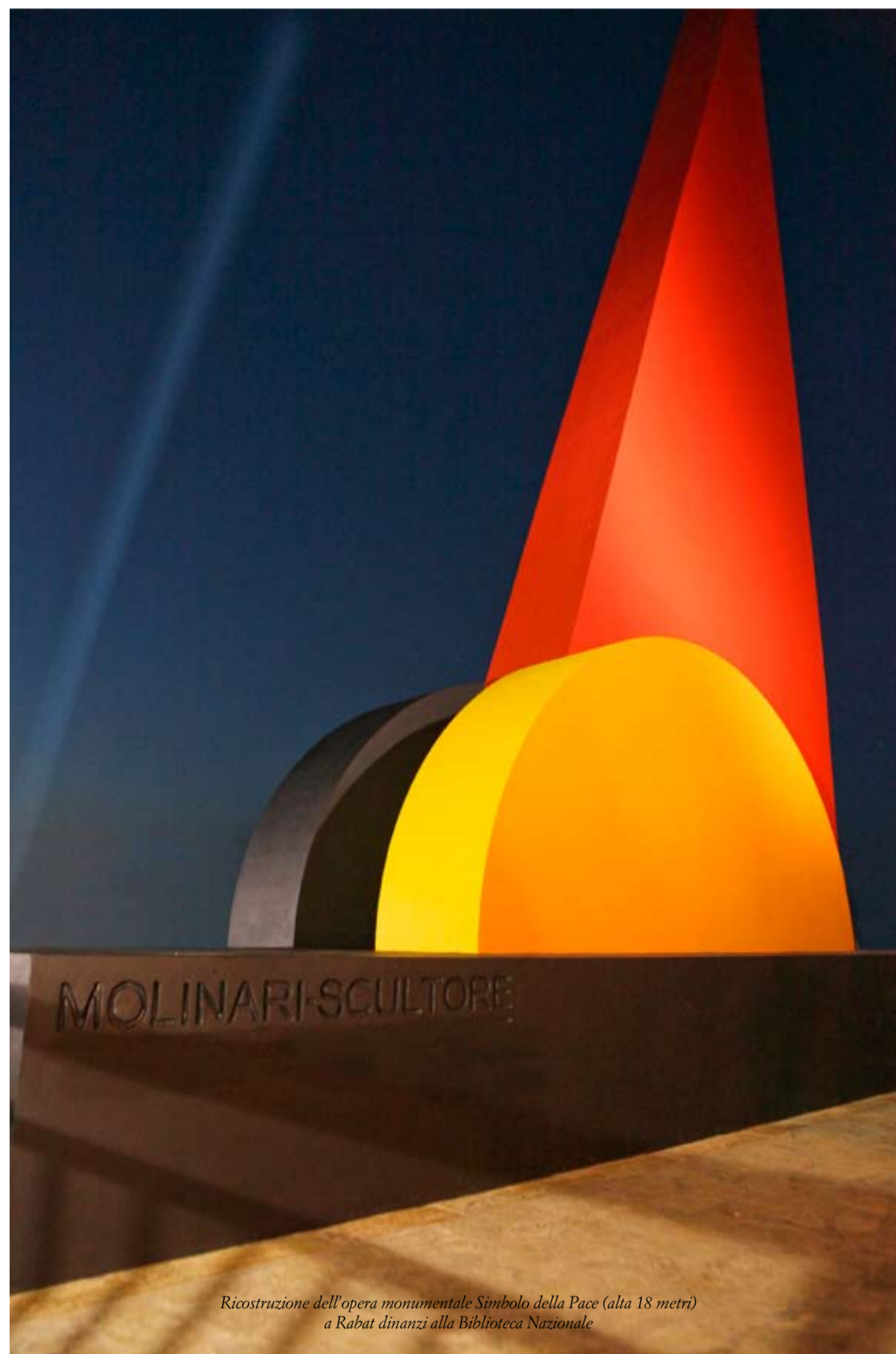
Ricostruzione dell'opera monumentale Simbolo della Pace (alta 18 metri) a Rabat dinanzi alla Biblioteca Nazionale

Lo scultore Mario Molinari è stato un artista di chiara fama, sensibile alle tematiche di pace e dialogo tra le culture, com'è testimoniato dalle sue numerose opere e dalla sua vita.