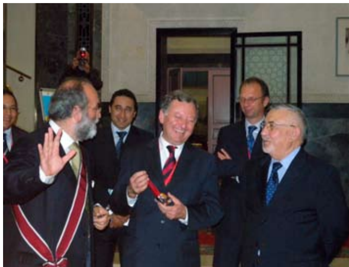
Il presidente Rudy Salles riceve in dono il "Totem della pace" a conclusione del suo mandato.