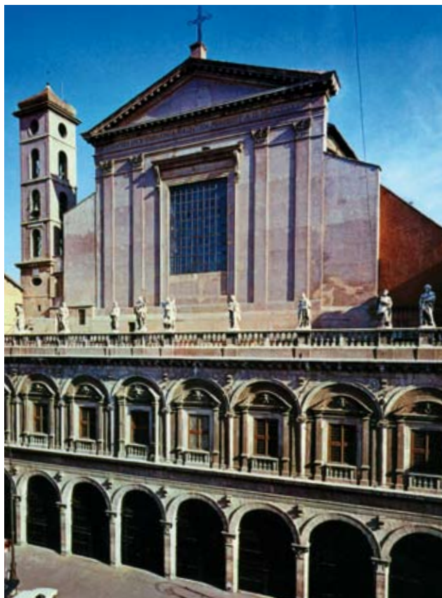
Basilica dei Ss. XII Apostoli e Convento OFM, Pza Ss. Apostoli, 51 Roma