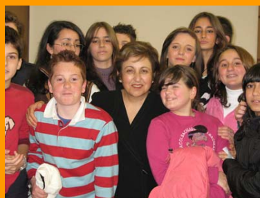
Il Premio Nobel Shirin Ebadi, membro della Fondazione Mediterraneo

Sono due scelte differenti e si possono utilizzare entrambe per destinare parte delle proprie imposte per fini diversi.