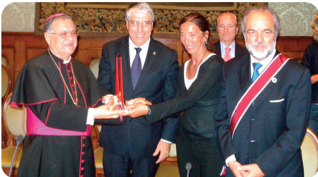
Palazzo Chigi, 13 ottobre 2010. Cerimonia di consegna del Premio Mediterraneo a S.B. Mons. Fouad Twal, Patriarca Latino di Gerusalemme