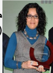
منى الطحاوي (مصر)

تقيم منى الطحاوي في نيويورك وهي كاتبة عمود بارزة ومتحدثة عامة حول القضايا العربية والإسلامية على المستوى الدولي. وتكتب منى الأعمدة لجريدة 'العرب' القطرية وجريدة 'جيروزالم بوست' الإسرائيلية وجريدة 'بوليتيكن' الدنماركية، كما نشرت لها مقالات الرأي في كل من جريدة 'واشنطن بوست' و'إنترناشونال هيرالد تريبيون'. وقبل انتقالها إلى الولايات المتحدة في عام 2000، عملت منى صحفية في عدة مناطق في الشرق الأوسط لأعوام، منها القاهرة والقدس حيث كانت مراسلة لوكالة رويترز.