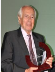
جان دانييل (فرنسا)

يعد جان دانييل، رئيس تحرير جريدة "Le Nouvel Observateur" اسما بارزا في الصحافة الفرنسية. وقد ولد لأسرة جزائرية واشتهر بتقاريره الصحفية التي كتبها من خط النار أثناء الحرب الجزائرية لجريدة "Express" حيث اتخذ موقفا مناهضا للتعذيب، وذلك قبل انضمامه لمجلة "Le Nouvel Observateur" عندما تأسست في عام 1964. وألف دانييل عددا من الكتب التي تناولت سيرة كبار المشاهير منها كتابه الذي جاء تحت عنوان 'مع كامو'.